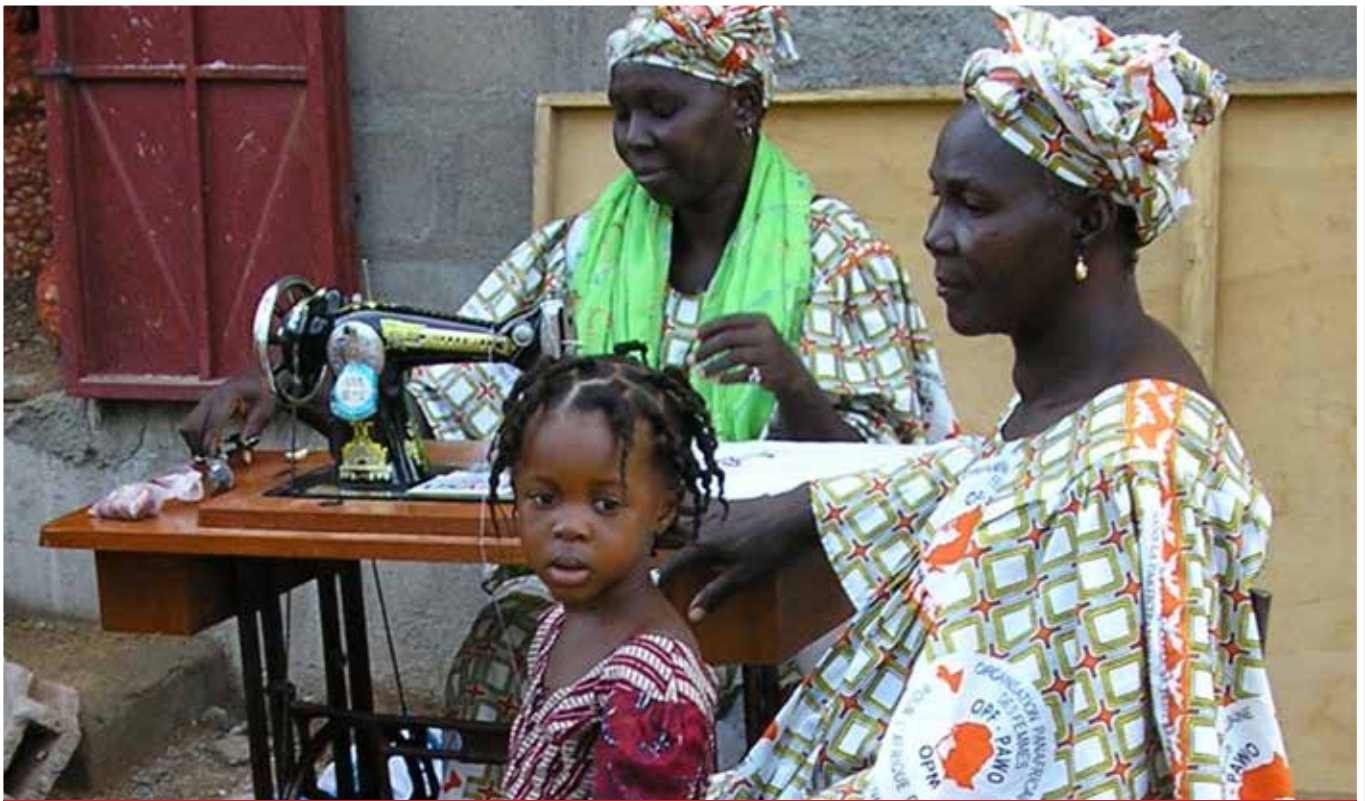
Fotografía ganadora del Primer Premio Categoría PDI/PAS. Autor: José Luis Santolaya.