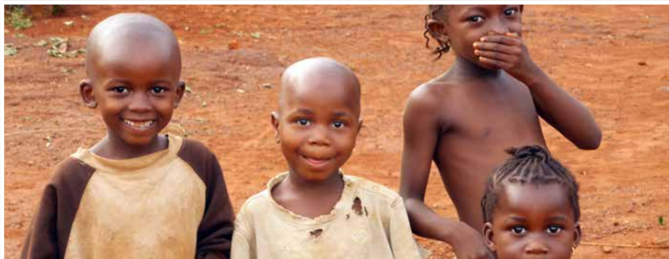
Fotografía de la serie ganadora del Primer Premio Categoría Estudiantes. Autora: María Teresa Narbona.

Habrà que repetirlo por enésima vez: en el mundo sobra comida para toda la humanidad. Nuestra soberbia tecnológica, capaz de hazañas que tan sólo hace unas décadas parecían cosa de brujas, muy bien podría aplicarse a la resolución de los acuciantes problemas de la humanidad. La prueba es obvia, mientras por aquí nos concentrábamos en nuestros asuntos, la ONU nos acaba de sorprender con un dato esperanzador, tres de los Objetivos de Desarrollo del Milenio –reducción de la pobreza extrema, acceso a agua potable y mejora de barrios marginales– se han cumplido antes de los plazos fijados para 2015 y 2020. La conclusión es clara: salvar vidas y corregir los más graves déficits sociales es fácil y, en términos comparativos, sumamente barato. ¿Sería demagógico decir que sólo el importe del rescate de Bankia equivale a dos tercios del dinero necesario para, según la FAO, erradicar el hambre en todo el mundo? ¿Y que ▶