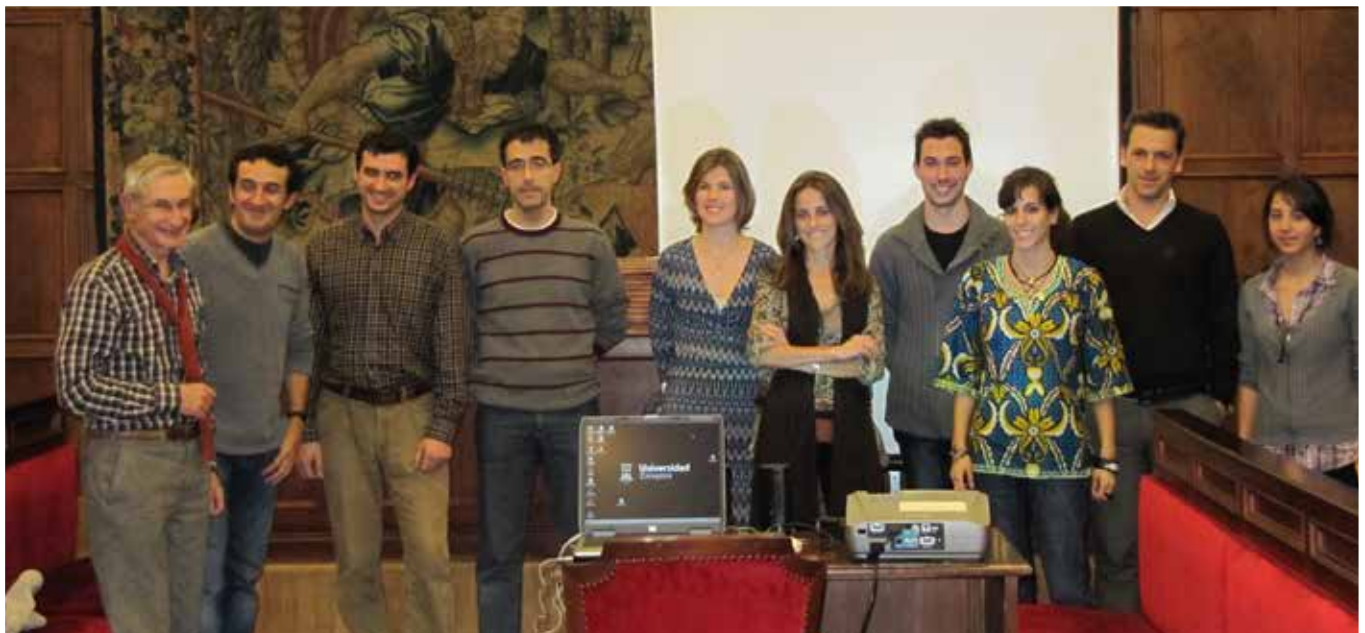
Premiados en la III Semana de la Cooperación para el Desarrollo.

21 a 24 de noviembre, en diversos edificios de la Universidad de Zaragoza