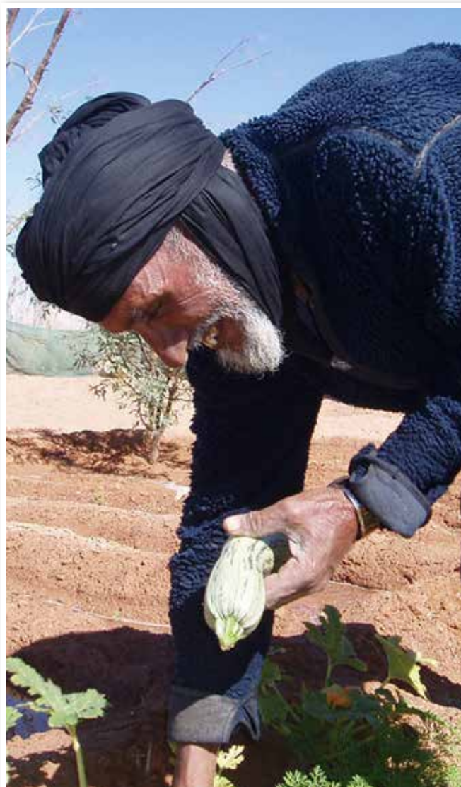
Fotografía de la serie ganadora del Segundo Premio Categoría Estudiantes.

En el área de Investigación no se publicó convocatoria por el motivo económico reseñado.