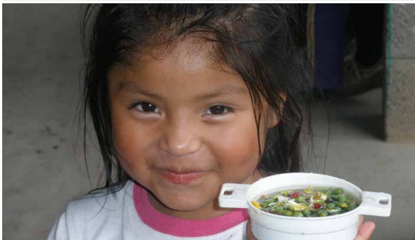
Fotografía ganadora del Tercer Premio Categoría Estudiantes. Autor: Daniel Ferrer Marzola.

Uno de los ámbitos importantes de la cooperación para el desarrollo es el científico-tecnológico, dado que la mayoría de los proyectos llamados de desarrollo precisan de soluciones técnicas de tipo científico, tecnológico o constructivo. Pero las soluciones a proporcionar deben guardar coherencia con los criterios de sostenibilidad, así como tener en cuenta el grado de desarrollo tecnológico del país y el nivel de formación de sus gentes, y ▶