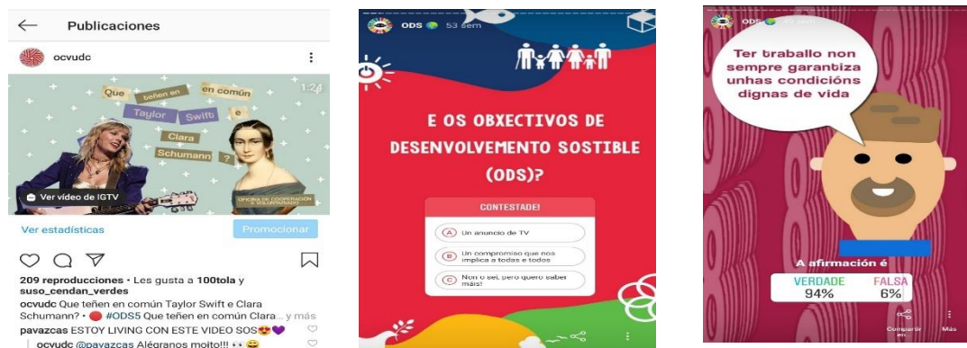
Figuras 2, 3 y 4: campaña para RRSS sobre los ODS.

Podemos contabilizar nuestros logros destacando la realización de más de 30 cursos, seminarios y actividades de sensibilización, en las que alrededor de 1.000 personas han sido participantes directas de nuestras acciones. Por su parte, el scaperoom ha recibido alrededor de 190 visitas, y también hemos llevado a cabo una campaña en RRSS sobre cada uno de los ODS (entre 340 y 430 personas visitaron cada post, 17 en total), lo que ha generado, por una parte, un aumento en el número de personas del público que nos sigue a través de dichas RRSS, el afianzamiento de las cuentas y de la comunidad 8 (por ejemplo, en Instagram). Se trataba de seguir trabajando en la promoción de los ODS tras el estallido de la pandemia en marzo de 2020 y el consecuente confinamiento. Evitar la presencialidad y el contacto físico, propició que buscáramos la forma de digitalizar nuestras propuestas, pero sin perder la posibilidad de interacción.